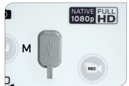
全高清图像/视频摄取

技术规格会随时变更。信息不具有法律约束力。内容只是涉及我们产品的信息。不允许进行全部或部分翻印。医疗器械只能在得到监管部门批准销售的国家中销售和使用。如欲查询允许销售市场的有关资料, 请与我们联系。